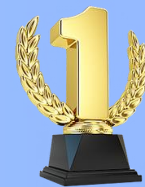
105-112學年度應屆畢業生錄取國內研究所人數